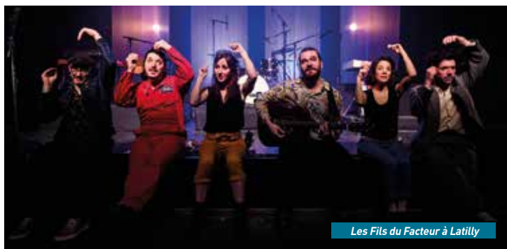
Les Fils du Facteur à Latilly

Pour le 13 juillet , on change l'habituel passage à Château-Thierry pour se rejoindre à Fère-en-Tardenois pour découvrir Guiz . Guiz est l'auteur d'un grand nombre de chansons incontournables du groupe Tryo depuis