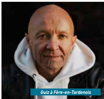
Guiz à Fère-en-Tardenois

Cartoon Machine transcende les frontières entre vos dessins-animés préférés et le rock dans un show dynamité d'énergie positive, pour le plus grand plaisir de tous les rockeurs avec une âme d'enfant !