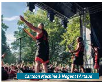
Cartoon Machine à Nogent l'Artaud

Le Festival Musique en Omois, soutenu et porté par le PETR-UCCSA, sera de retour du 4 juillet au 1 er août prochain et vient d'annoncer les têtes d'affiches de sa programmation et surtout, la liste des communes qui accueilleront le festival.