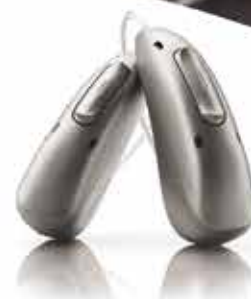
Phonak Audéo R Infinio