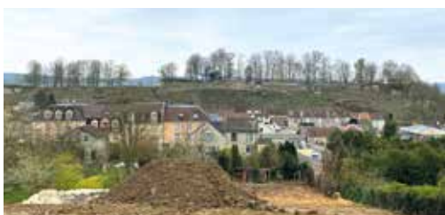
Sur le site de l'ancien café : vue imprenable sur la partie nord du château

teau médiéval, progressivement mise en valeur. Cette démolition s'inscrit dans une politique plus large de lutte contre les friches urbaines et de requalification des espaces délaissés. Un projet d'aménagement à long terme sera ensuite étudié pour redonner vie à ce site en répondant aux attentes des habitants ●