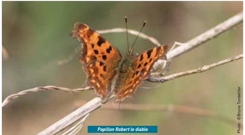
Papillon Robert le diable

Depuis plusieurs années, Picardie Nature mobilise le grand public autour de ses enquêtes "Un mois - Une espèce". Pour l'année 2025, le format évolue avec une espèce mise en lumière tous les deux mois, afin de permettre à chacun de mieux la découvrir et de participer activement aux recensements. Pour débiter, c'est le Robert-le-Diable qui ouvre la danse. Facilement reconnaissable avec ses ailes orangées aux contours découpés, ce papillon apprécie les milieux boisés et humides, mais se laisse aussi observer dans les parcs et les jardins. Durant ces deux mois, Picardie Nature propose aux curieux de suivre ses publications hebdomadaires sur les réseaux sociaux pour mieux comprendre le cycle de vie du papillon, ses besoins et les gestes à adopter pour le protéger. En parallèle,