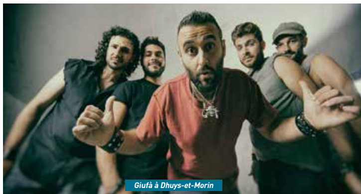
Giufà à Dhuys-et-Morin

Rendez-vous à la fin juin pour connaître la programmation complète, l'ensemble des premières parties, les nouveautés, les moments clé... ●