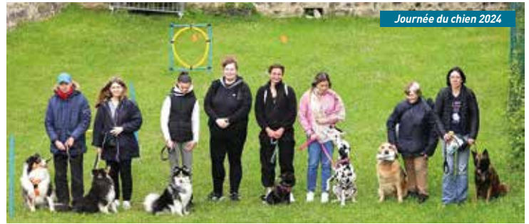
Journée du chien 2024

libre accès permettra aux chiens et à leurs maîtres de se divertir sous la surveillance des bénévoles attentifs, tandis que des démonstrations en tout genre viendront rythmer le week-end. Des stands d'exposants spécialisés, des conseils d'experts en éducation et bien-être animal, ainsi que de nombreux lots à gagner grâce aux partenaires locaux viendront enrichir cette