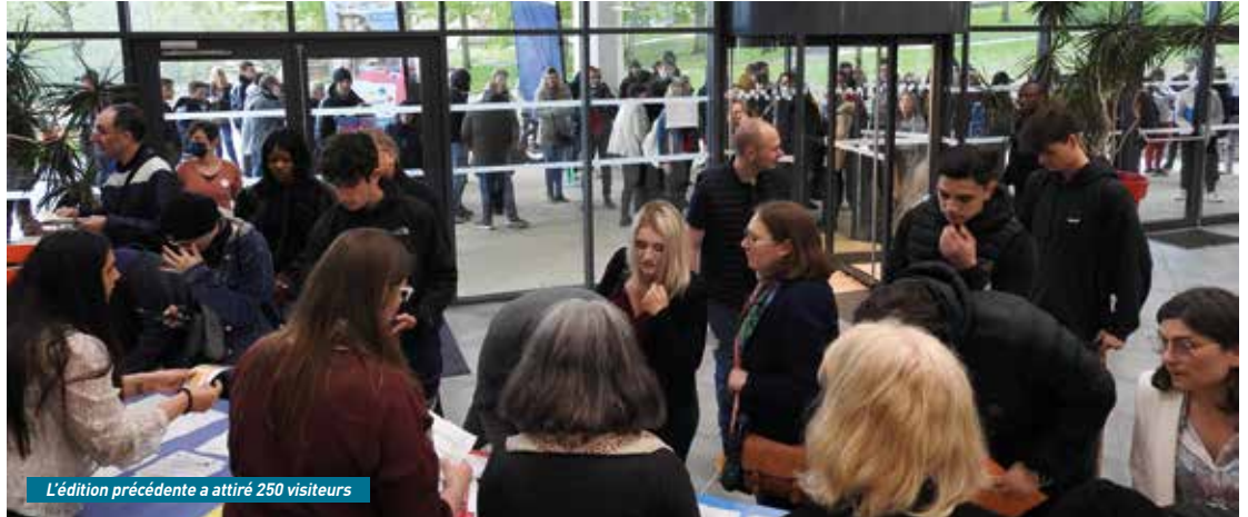
L'édition précédente a attiré 250 visiteurs

Vous recherchez un emploi ? Une formation ou une alternance ? Ou bien simplement des informations pratiques et concrètes dans votre parcours de retour à l'emploi ? Munissez-vous de votre CV en plusieurs exemplaires et participez à cet événement atypique réunissant une soixantaine d'exposants, aussi bien des entreprises que des organismes de formation, dans le domaine de l'hôtellerie/restauration, du commerce, du transport et de la logistique, du bâtiment, de l'industrie, du service aux entreprises et à la personne notamment. L'Unité Territoriale d'Action Sociale (UTAS) sera également présente dans le cadre de l'insertion, mais aussi pour un accompagnement spécifique si nécessaire. « La plupart des entreprises recrutent