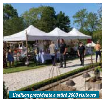
L'édition précédente a attiré 2000 visiteurs

des bijoux, de la couture, mais aussi des stands de brocante pour jardin, sans oublier les traditionnelles plantations. Soit un total de 35 exposants, le triple par rapport à la première édition. « Mon but est de fédérer, d'être ensemble. Cela nous rend plus fort », ajoute Emilie Camus, très impliquée dans la promotion des artistes et artisans d'art locaux avec l'ASCAA. Une anima-