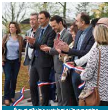
Élus et officiels assistent à l'inauguration

commerces et d'un espace sécurisé de rencontre, la conception de noues cloisonnées et de tranchées drainantes pour une gestion immédiate des eaux pluviales, le développement des mobilités douces avec de nouveaux cheminements piétons et de voies cyclables, et enfin une végétalisation de ce lieu de vie. Clésence est déjà intervenu avec la démolition de 30 logements et la réhabilitation de 554 d'entre eux. L'ensemble des travaux s'étalera sur une durée de 3 ans pour un budget global de 2 981 447 €, dont 80% financés par différents acteurs ●