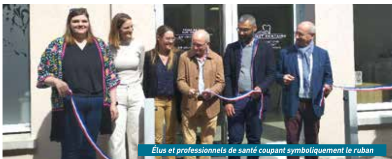
Élus et professionnels de santé coupant symboliquement le ruban

de 215.95 m 2 . « Nous avons volontairement surdimensionné les capacités d'accueil des infrastructures dans la perspective où de nouveaux praticiens voudraient s'installer. Nous nous réjouissons que ce soit le cas aujourd'hui. Qui plus est, avec ce nouveau corps de métiers au sein de la maison de santé », se réjouit Etienne Haÿ, président de la CARCT. Pour rappel, les maisons de santé permettent de répondre à la désertification médicale en donnant la possibilité aux professionnels d'exercer en collectif, tout en leur facilitant l'installation. Prise de rendez-vous par mail à cabdentaire.baillly.perrot@gmail.com, par téléphone au 03 23 69 98 17 ou sur Doctolib.fr ●