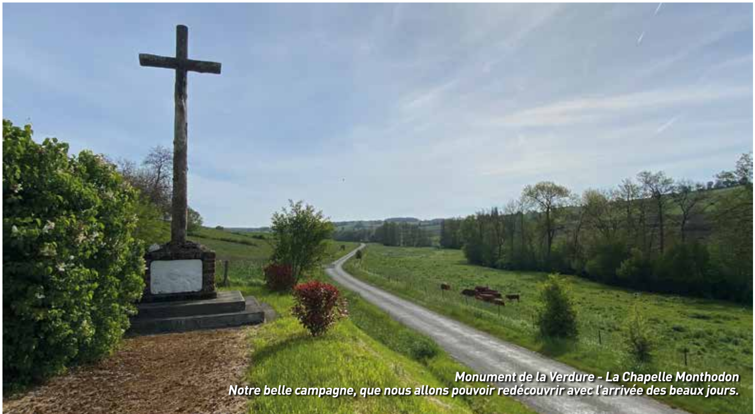
Monument de la Verdure - La Chapelle Monthodon Notre belle campagne, que nous allons pouvoir redécouvrir avec l'arrivée des beaux jours.