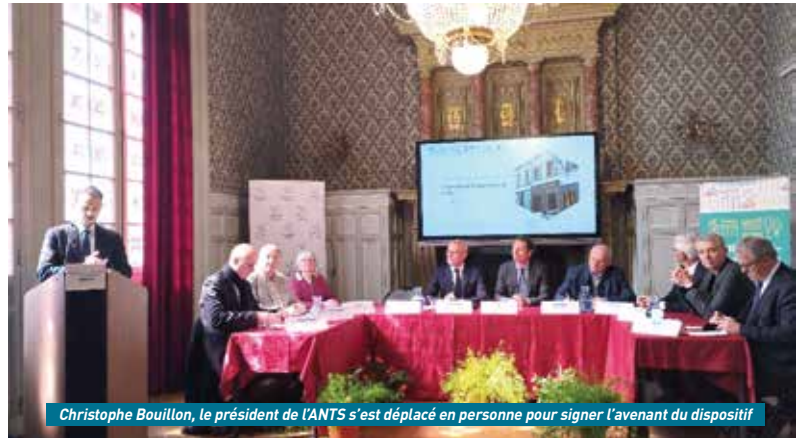
Christophe Bouillon, le président de l'ANTS s'est déplacé en personne pour signer l'avenant du dispositif

La municipalité castelle a mis en place une politique ambitieuse visant à lutter contre la vacance des logements et à offrir des habitations saines et abordables aux résidents. Des mesures incitatives ont été proposées aux propriétaires, des interventions directes ont été réalisées sur des zones à réhabiliter, et des constructions spécifiques ont été encouragées, contribuant à une baisse significative de 25% des logements vacants depuis plus de 2 ans. Des aides directes de 115 000 € ont été accordées aux commerçants