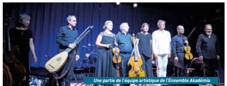
Une partie de l'équipe artistique de l'Ensemble Akadémia

mai à 20h30, à l'Abbatiale d'Essômes-sur-Marne sera proposé le Concert des oiseaux interprété par La Réveuse . Enfin dans le cadre des Rencontres Poétiques, le dimanche 19 mai de 14h à 17h dans la cour de la Médiathèque