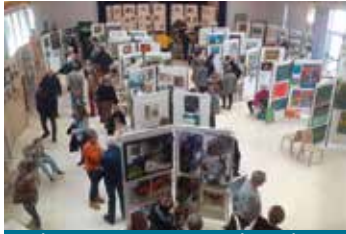
Près de 700 visiteurs ont arpenté les allées du salon tout au long du week-end

Organisée par l'Association pour l'Organisation de Loisirs et d'Activités Culturelles (AOLAC), la 23 ème édition du salon de la peinture de Chierry, qui s'est déroulée les 9 et 10 mars derniers à la Maison du parc Bellevue, n'a pas failli à sa réputation.