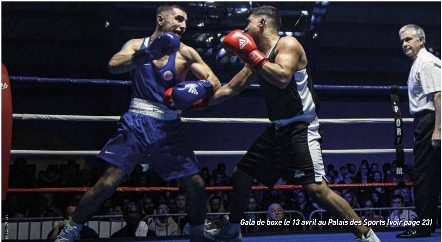
Gala de boxe le 13 avril au Palais des Sports (voir page 23)