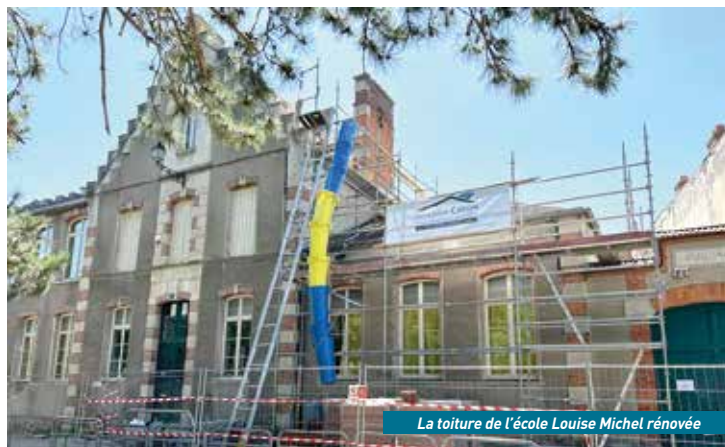
La toiture de l'école Louise Michel rénovée