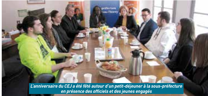
L'anniversaire du CEJ a été fêté autour d'un petit-déjeuner à la sous-préfecture en présence des officiels et des jeunes engagés

Lancé le 1 er mars 2022, le CEJ est un dispositif d'accompagnement intensif qui cible l'ensemble des moins de 26 ans qui ne sauraient s'inscrire par eux-mêmes dans l'emploi durable. Les jeunes travailleurs précaires peuvent également y prétendre. Véritable contrat signé entre le jeune et la Mission Locale qui l'accompagne, il engage les 2 parties à travers un parcours personnalisé et une mise en activité systématique de 15/20 heures par semaine, en contrepartie d'une allocation financière d'un montant maximum de 520 € par mois pour les jeunes qui en ont besoin. Les jeunes sans diplôme ou de niveau infra-bac représentent plus de la moitié des jeunes en CEJ (55% des jeunes