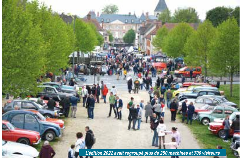
L'édition 2022 avait regroupé plus de 250 machines et 700 visiteurs