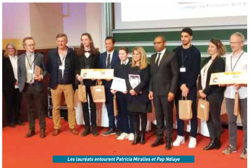
Les lauréats entourent Patricia Miralles et Pap Ndiaye