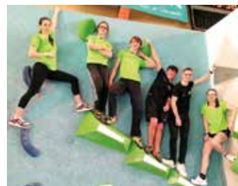
Le quatuor gagnant (en vert) du lycée Jules Verne et les 2 jeunes formés (en noir) pour devenir juge-arbitre