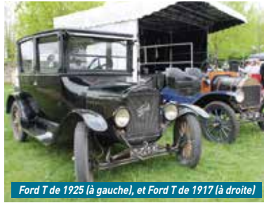
Ford T de 1925 (à gauche), et Ford T de 1917 (à droite)

rendu possible grâce à un partenariat entre de nombreuses structures : la municipalité, mais aussi plusieurs associations locales chargées de rassembler les troupes : Les Pistons Champenois pour les deux-roues, le Groupe Force Téléthon pour l'intendance, les jeux et les animations, Aux Véhicules Militaires de la Libération pour tout ce qui est en lien avec les engins militaires et MAI en Mons-Mirabilis pour les voitures et autres curiosités.