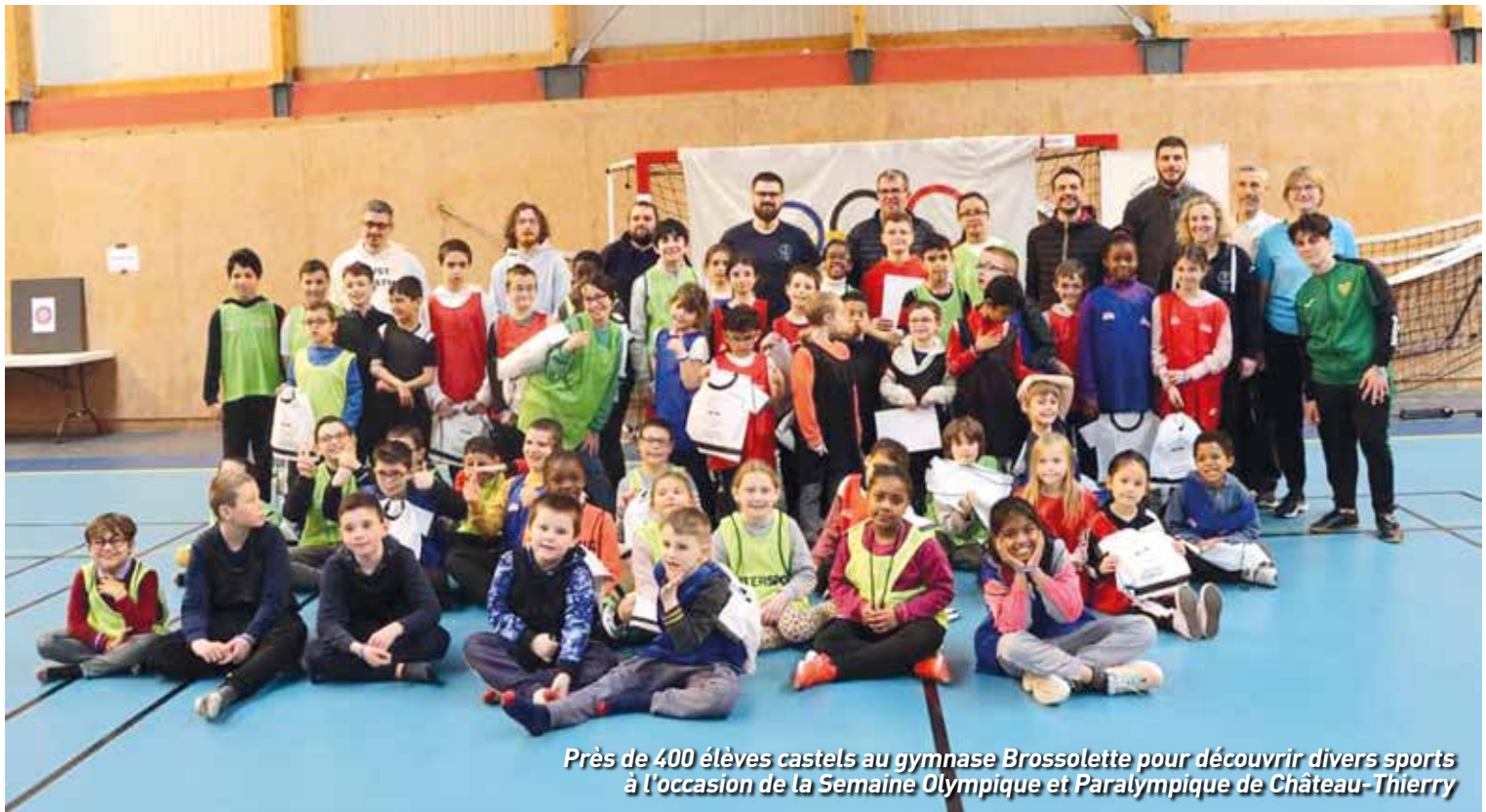
Près de 400 élèves castels au gymnase Brossolette pour découvrir divers sports à l'occasion de la Semaine Olympique et Paralympique de Château-Thierry