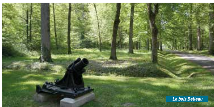
Le bois Belleau

couvrir le territoire et la vigne de manière ludique et interactive. Courses, randonnées, dégustations, activités dans les vignes ou en cave, il y en aura pour tous les goûts et par tous les temps lors des 4 saisons de la vigne 2023 ● JI