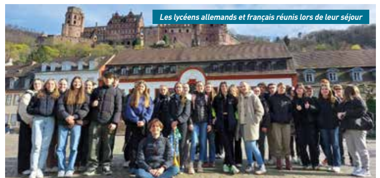
Les lycéens allemands et français réunis lors de leur séjour

convivialité. Il s'agit pour les jeunes français de retrouver leurs camarades déjà venus à Château-Thierry en début d'année scolaire. Cet échange à la fois culturel, linguistique et amical est un moment fort de partage. Mais au-delà de l'échange, c'est aussi une manière de pérenniser un partenariat ininterrompu depuis 55 ans avec le Nikolaus-Kirstner-Gymnasium