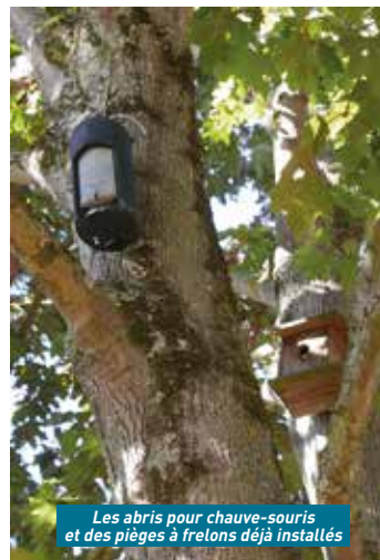
Les abris pour chauve-souris et des pièges à frelons déjà installés

de la part des votants tels un projet de jets d'eau aux Vaucrises et l'aménagement des berges du quai Couesnon (chacun 33 points), la rénovation de la façade du Palais des sports (27 points), un emblème touristique en lettres géantes (20 points), une aire de jeux au Clos des Vignes (13 points), la copie de la statue de Jean de la Fontaine (5 points) ou encore l'amélioration de l'éclairage public rue de la Banque (bon dernier avec seulement 3 points).