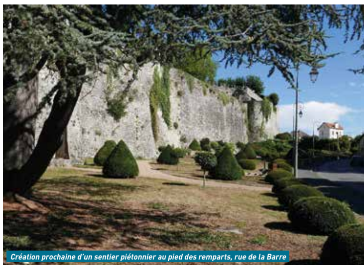
Création prochaine d'un sentier piétonnier au pied des remparts, rue de la Barre

Enfin, la ville a beau être ouverte aux populations de tout poil et les Castels vouloir protéger et chérir les animaux au pays de La Fontaine... rappelons qu'il est toujours prohibé de nourrir les cygnes même si cela amuse les enfants. Ces oiseaux digèrent très mal le pain qui obstrue leur estomac et peut leur être fatal. Quant aux chats errants, plutôt que de coûteuses croquettes pour gentils minous, laissons-les faire bonne chère de quelque souriceau aperçu de leur balcon ! ●