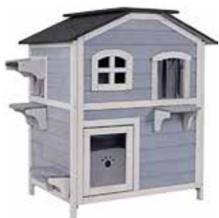
Projet vainqueur 2022 - Des chalets pour chats errants en divers points de la ville

Plus original pourtant s'avère être le projet arrivé très largement en tête dans les urnes qui consiste en l'implantation en divers points de la ville de petits chalets pour chats errants « afin - selon les initiateurs - de les nourrir et de gérer plus aisément leur reproduction » (10 000 €).