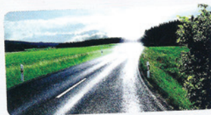
SANS VERRES POLARISANTS

Les reflets lumineux peuvent être à l'origine de réverbérations irritantes pour l'œil. Les verres polarisés ZEISS permettent de filtrer ces reflets gênants. Autre avantage non négligeable : la vision gagne en précision. Les contours deviennent plus nets, les yeux sont moins éblouis et fatigués en cas de forte luminosité. En d'autres termes, ces verres ne se contentent pas de protéger les yeux du soleil : en éliminant les réverbérations, ils assurent également une meilleure vision.