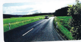
AVEC VERRES POLARISANTS

*Offre valable du 18 mai au 30 août 2015 soumise à l'achat d'un premier équipement en verres progressifs traités en Teflon de marque ZEISS ou de gamme SOLA de même puissances limitées à -3.00/+3.00 cylindre max. 2.00. Seconde monture à choisir dans la collection indiquée en magasin. En cas de rupture sur un modèle, nous nous engageons à fournir un modèle substituable de qualité et prix comparables. Sous réserve d'erreurs typographiques. Visuels non contractuels.